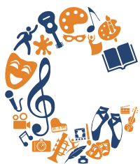
Cultuur voor Iedereen